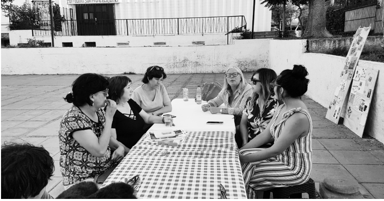
Santa Adela Histórico en la mesa comunitaria realizada el sábado 23 de Marzo en Plaza Mayor de Villa Santa Adela.