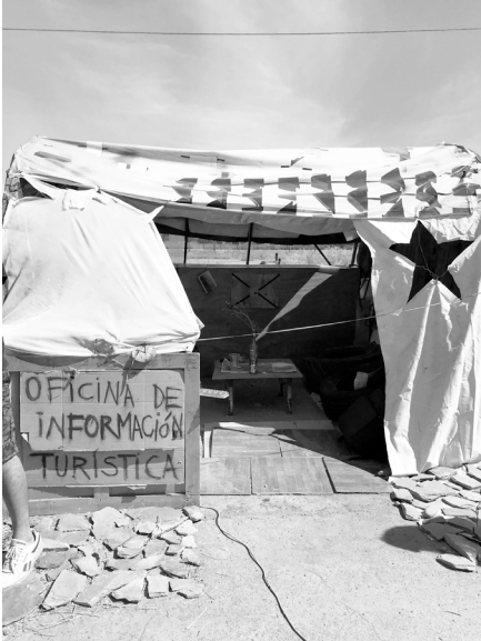
Tijerales de la Torre de Control y la oficina del viajes de #LAJUNIOR