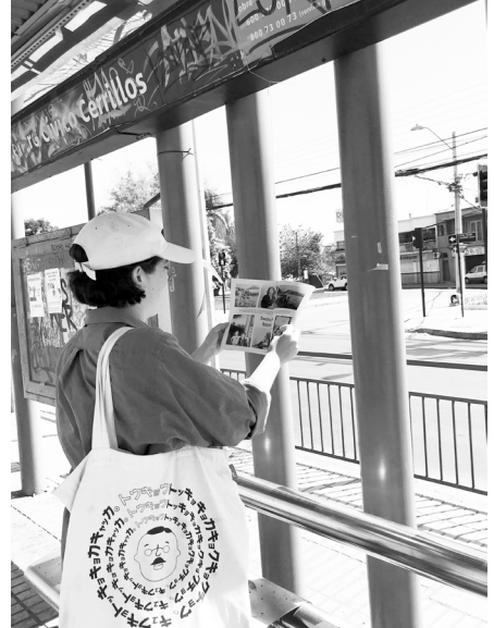
Acción Semanario Amistad en paraderos de Cerrillos